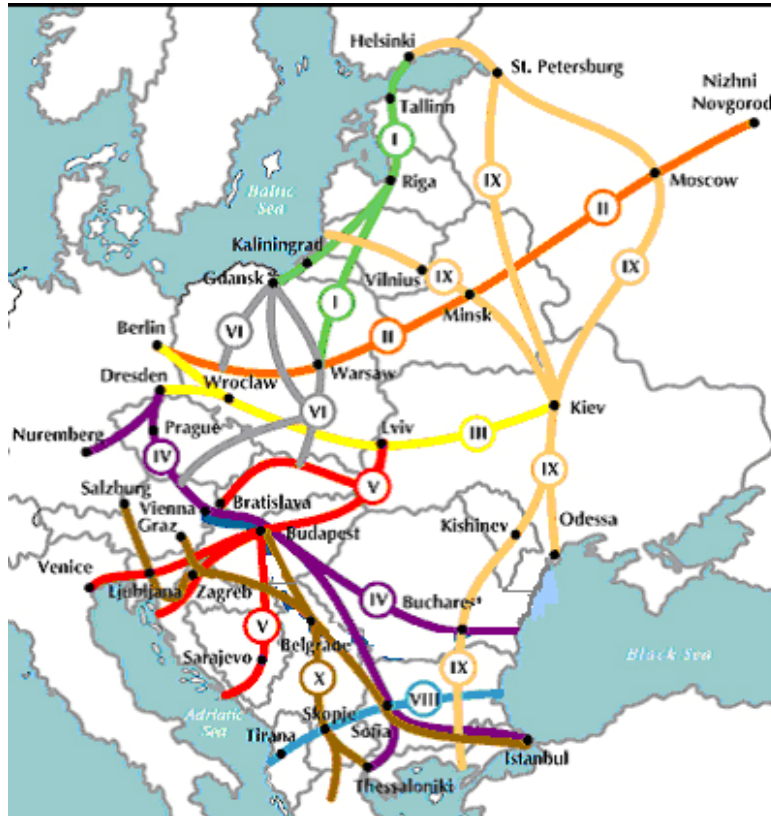
Harta 1: Culoarele de transport europene și concesiia făcută României pe traseul IV